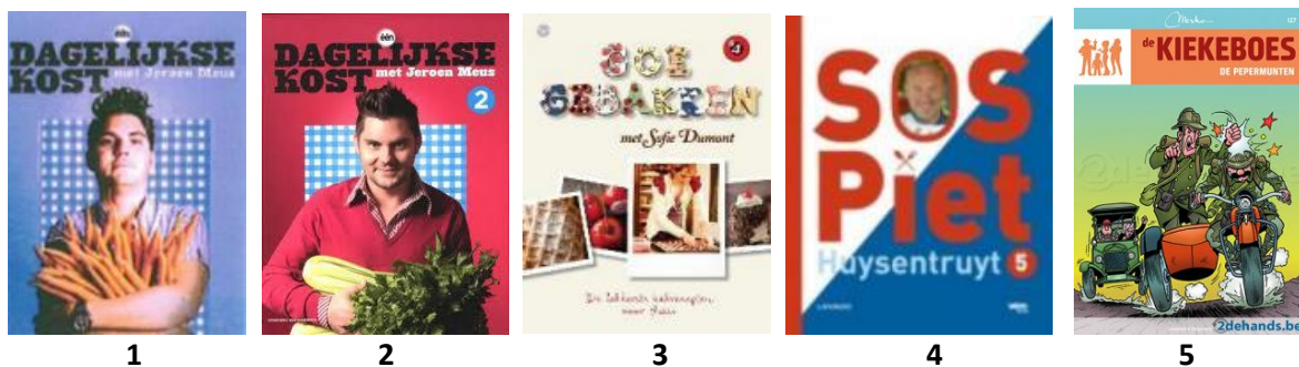
De top 5 van 2010